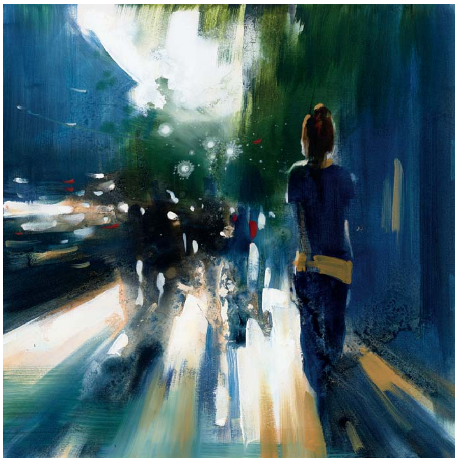
The afternoon 02 Öl auf Leinwand 60 x 60 cm