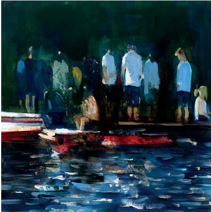
Treffpunkt Ufer 02 Öl auf Leinwand 60 x 60 cm