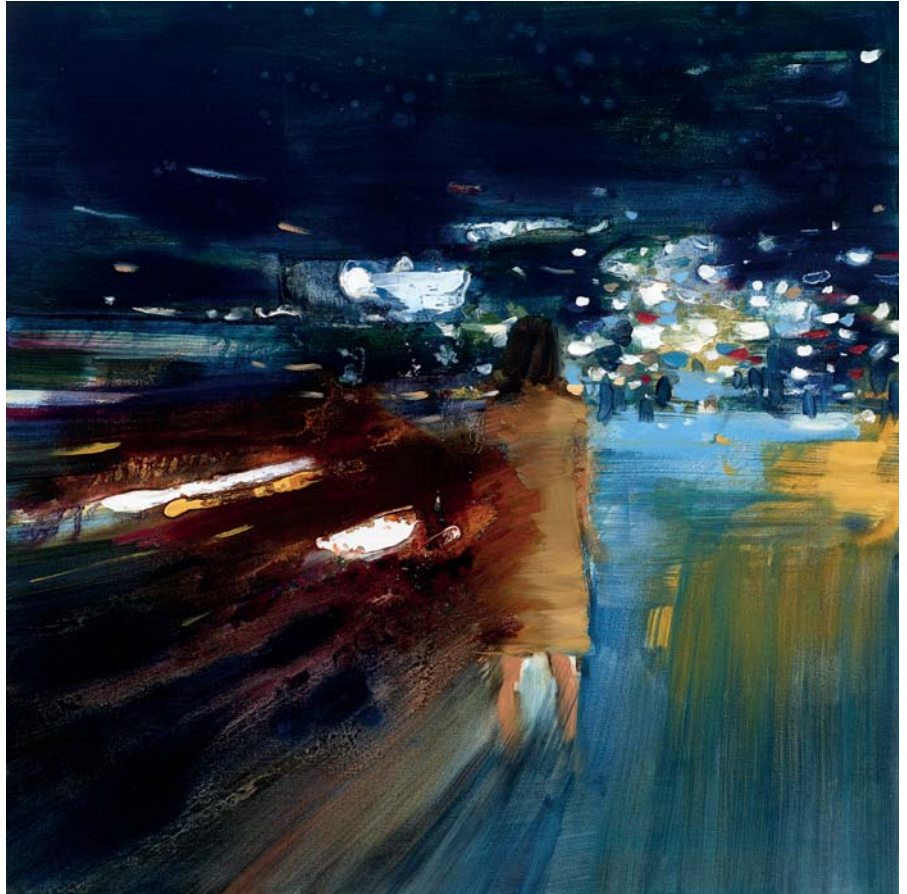
Bye beauty Öl auf Leinwand 60 x 60 cm