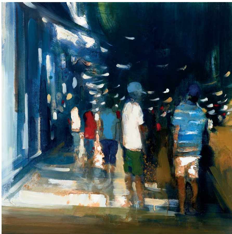
People from around the corner Öl auf Leinwand 60 x 60 cm