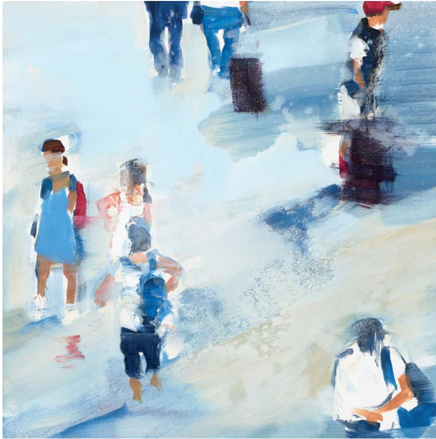
Date prisă 01 Öl auf Leinwand 60 x 60 cm