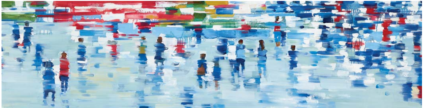
La plaza 08 Öl auf Leinwand 50 x 190 cm