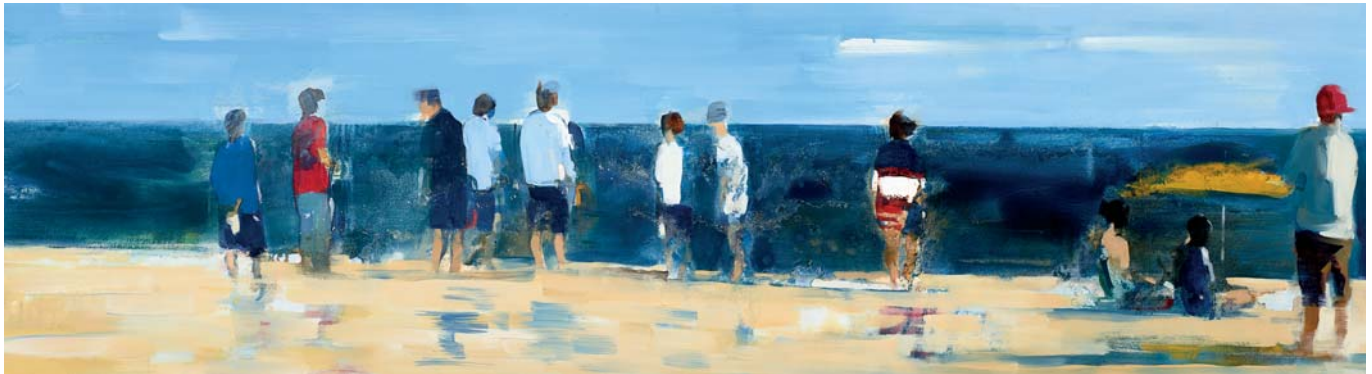
Beachlife Öl auf Leinwand 50 x 180 cm