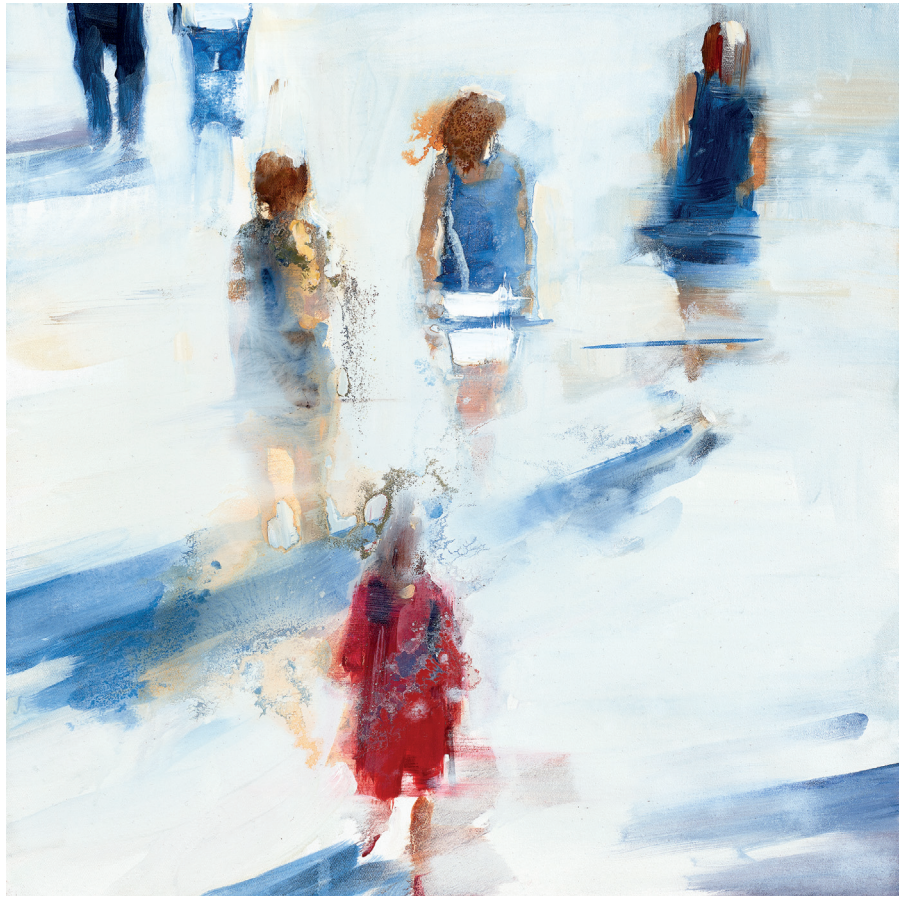
Date prise 02 Öl auf Leinwand 60 x 60 cm